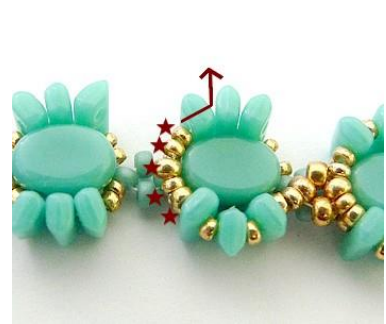
24) Plaats 2 R15, 1 R11, 2 R15 in de Piros.