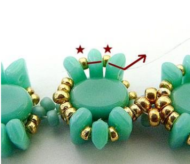
25) Plaats 2 keer 1 R15 in de Piros.