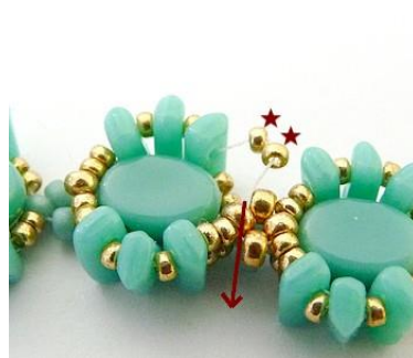
26) Plaats 2 R15 in de centrale R11.