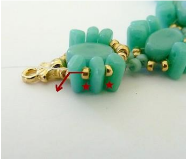
16) Plaats 2X 1 R15 tussen de Piros.