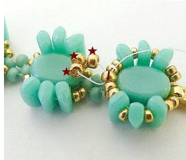
20) Plaats 3 R11 in een rondje in de centrale R11 en verstevig !