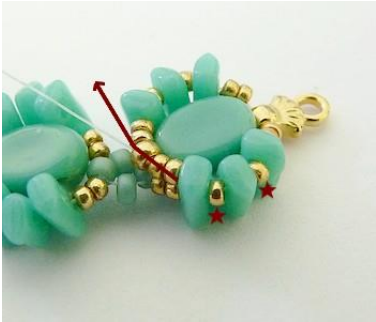
19) Plaats 2 keer 1 R15 in de Piros en zet de naald in de centrale R11.