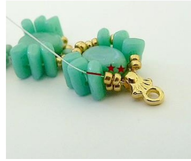
18) Plaats 2 R15 in de Piros.