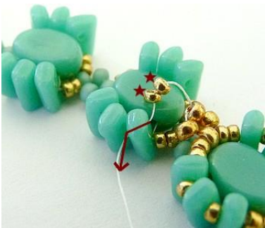
22) Plaats 2 R15 in de Piros.