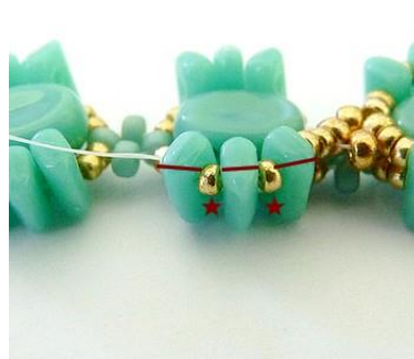
23) Plaats 2 keer 1 R15 in de Piros.