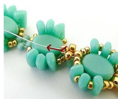
21) Plaats de naald HIER in de centrale R11.