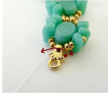
17) Plaats 2 R15 in de Cymbal.