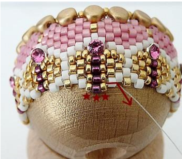
37) Plaats 1 R15, 1 DB, 1 R15.