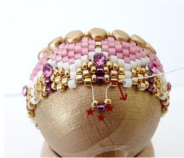
32) Plaats 1 R15, 1 DB, 1 R15 in de gouden DB. GR