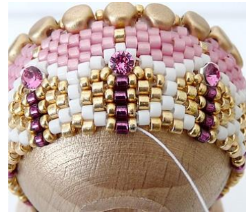
39) Dat ziet er zo uit. 😊 Plaats de naald HIER.