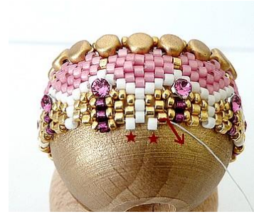
33) Plaats 2 x 1 witte DB.