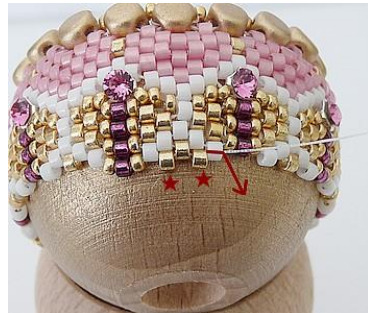
38) Plaats 2 x 1 gouden DB. Herhaal stappen 36 en 37 GR.