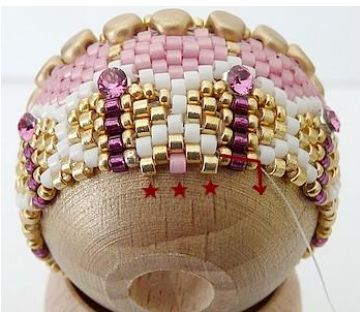
40) Plaats 1 gouden DB, 1 roze DB, 1 gouden DB. Ga door de 3 parels. GR