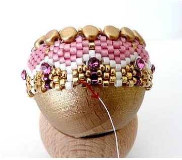
31) Plaats de naald HIER (gouden DB).