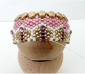
34) Ga door de groepjes parels. Herhaal stappen 32 en 34. GR