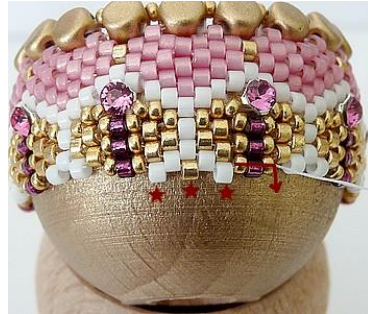
35) Plaats 1 witte DB, 1 gouden DB, 1 witte DB en ga door de 3 parels. GR