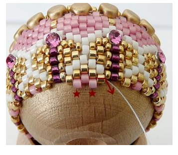
42) Plaats 2 x 1 roze DB.