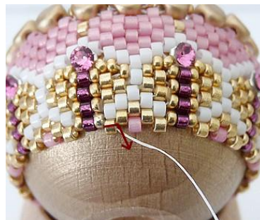
41) Dat ziet er zo uit 😊 Plaats de naald dan HIER.