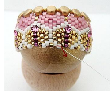
36) Plaats de naald HIER (witte DB).