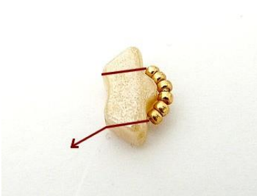
1) Plaats 1 Delos, 6 R15, ga door de Delos.