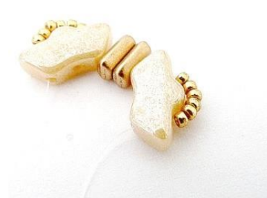
3) Herhaal stap 1 en 2, en doe dit 4X in totaal.