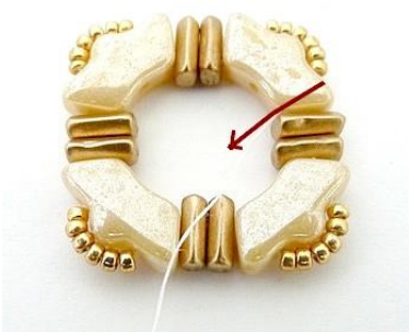
4) Dan krijgen we dit 😊, plaats de naald in de Delos.