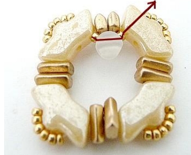
5) Plaats tussen de Delos, 1 R15, 1 Kalos, 1 R15. De Piros zetten zich mooi recht. 😊