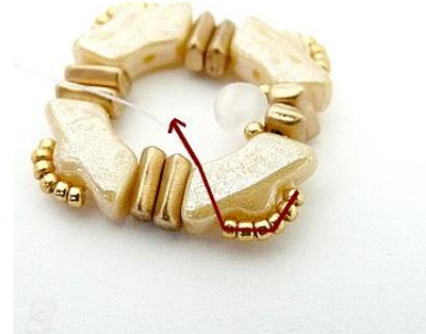
6) Plaats de naald HIER en herhaal stappen 5 en 6 over de gehele rij.