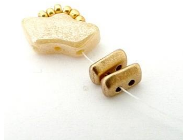
2) Plaats 2 Piros (onderste opening).