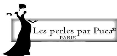
Schéma BO « Kamala » par PUCA®