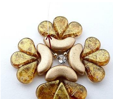
4) Placer 1 R 15, 1 SM, 1 R 15 sous l'Arcos