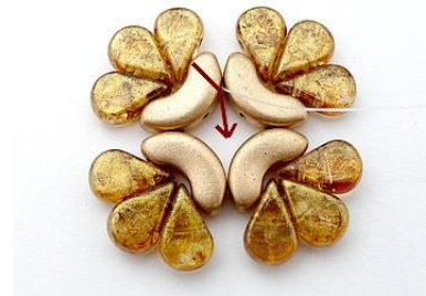
3) Faire 4 x et fermer, se placer ICI