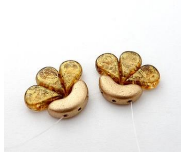
2) Répéter étape 1