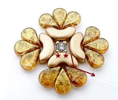
6) Placer 1 R 15 passer dans la Mesh, 1 R 15 et se placer ICI