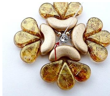
5) venir se placer dans l'Arcos en face ICI