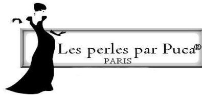
Schéma Bijou de sac « Victoria© » par PUCA®