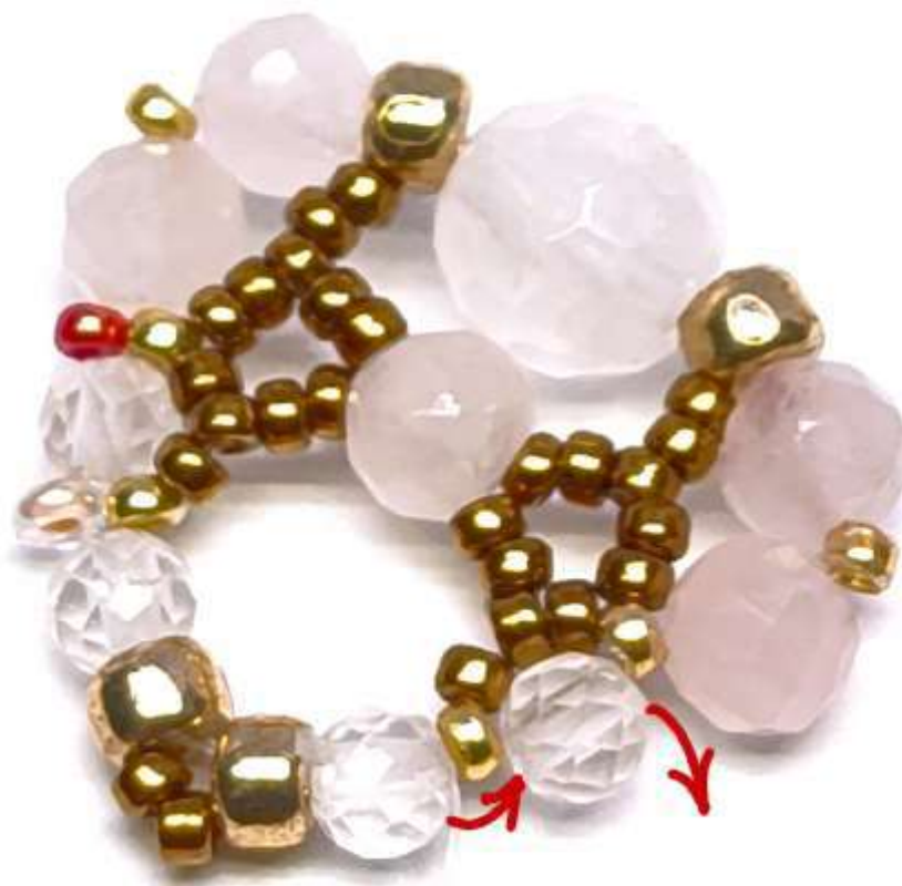
1 Toho DemiRound 11/0