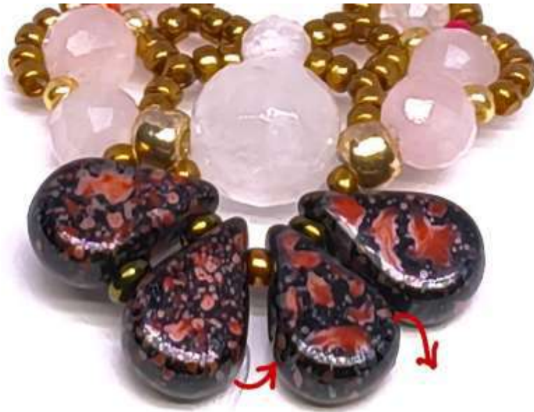
1 Toho DemiRound 11/0