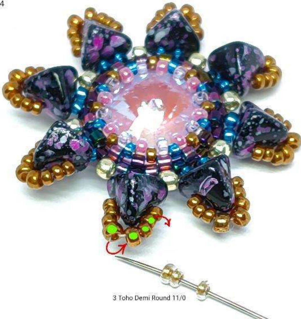
3 Toho Demi Round 11/0