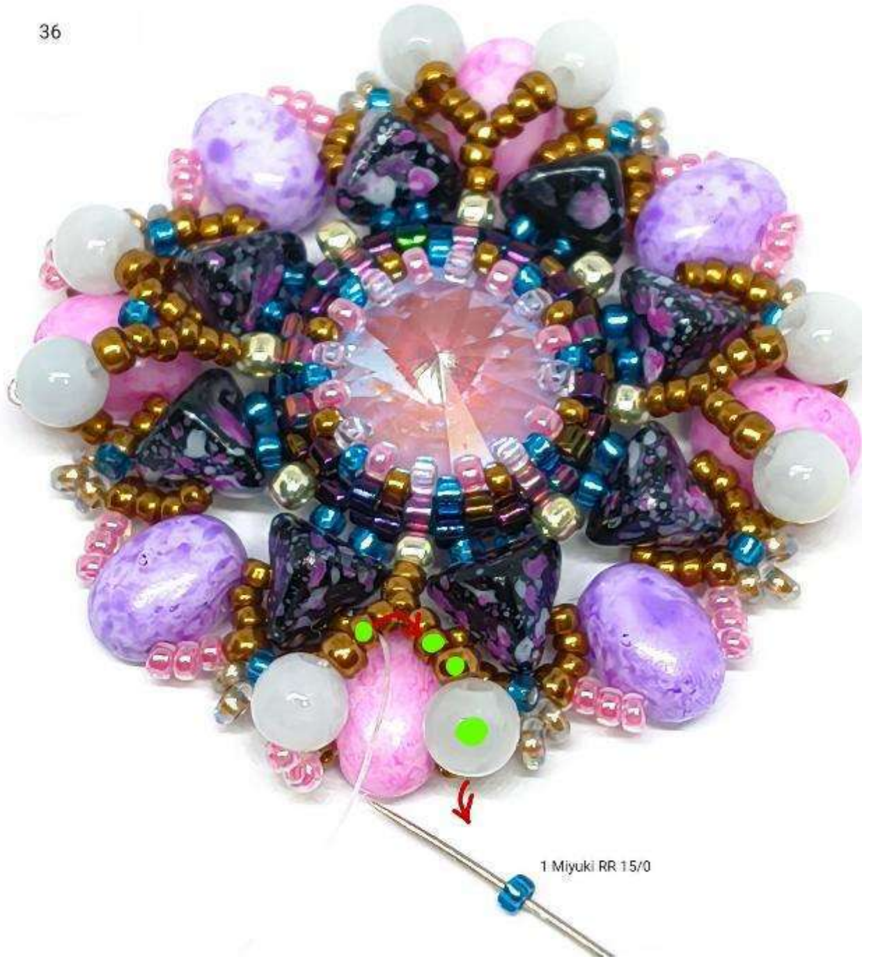
1 Miyuki RR 15/0