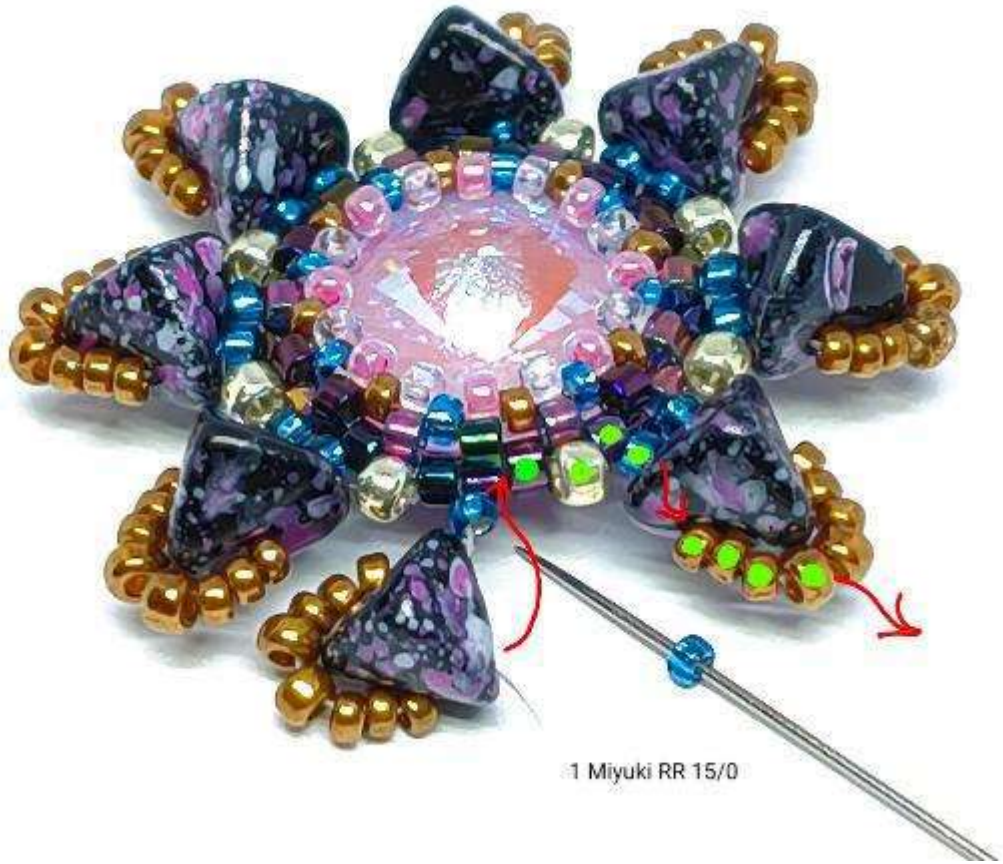
1 Miyuki RR 15/0