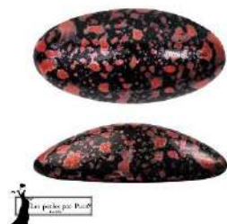
4 Athos® (sin agujeros) par Puca®-Paris Enamel Red