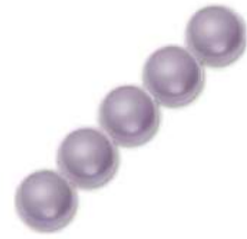
34 Perlas 4 mm (P4) Opaque Luster Amethyst