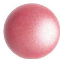
2 Cabochons 18 mm par Puca®-Paris Dark Rose Pearl