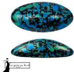
4 Athos® (sin agujeros) par Puca®-Paris Enamel Turquoise