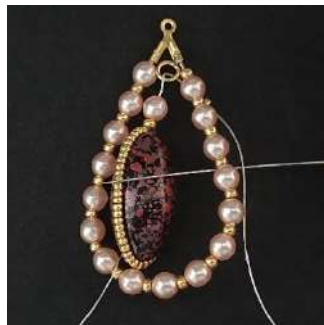
19) Pasar por el interior del soporte