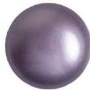
2 Cabochons 18 mm par Puca®-Paris Violet Pearl