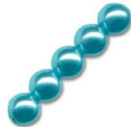
34 Perlas 4 mm (P4) Dark Turquoise