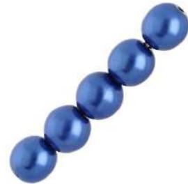
34 Perlas 4 mm (P4) Marine Blue