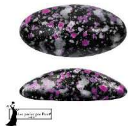
4 Athos® (sin agujeros) par Puca®-Paris Enamel Pink