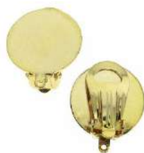
2 clips para pendientes con base de 18 mm para orejas no perforadas