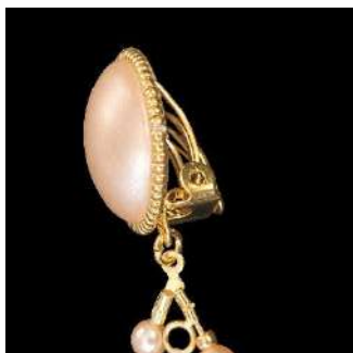
25) Colocar la anilla en los 2 soportes de pendientes