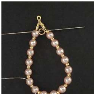
17) Pasar por la anilla y salir por debajo