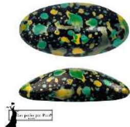
4 Athos® (sin agujeros) par Puca®-Paris Enamel Green