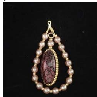
24) Aquí está el resultado