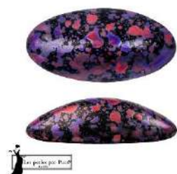
4 Athos® (sin agujeros) par Puca®-Paris Enamel Purple and Red