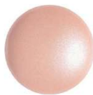
2 Cabochons 18 mm par Puca®-Paris Light Peach Pearl