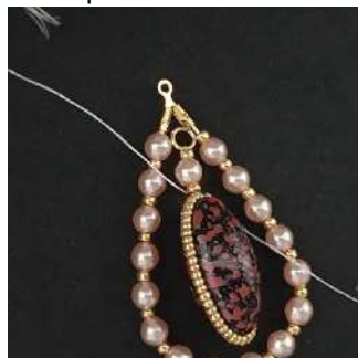
23) Hacer un doble nudo