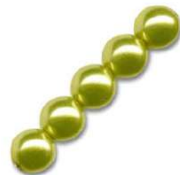
34 Perlas 4 mm (P4) Olivine