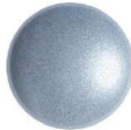
2 Cabochons 18 mm par Puca®-Paris Light Blue Pearl