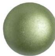
2 Cabochons 18 mm par Puca®-Paris Pastel Olivine