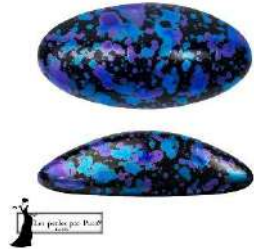
4 Athos® (sin agujeros) par Puca®-Paris Enamel Blue