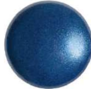
2 Cabochons 18 mm par Puca®-Paris Dark Blue Pearl