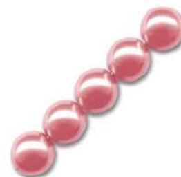
34 Perlas 4 mm (P4) Antique Rose