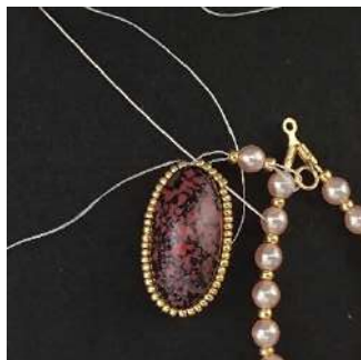
22) Pasar nuevamente por todas las perlas del lado opuesto por donde llegó anteriormente