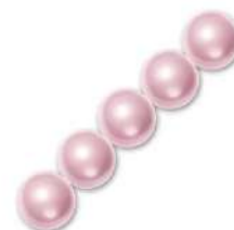
34 Perlas 4 mm (P4) Rosaline Pearl