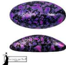
4 Athos® (sin agujeros) par Puca®-Paris Enamel Purple and Pink