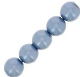
34 Perlas 4 mm (P4) Sea Foam