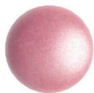
2 Cabochons 18 mm par Puca®-Paris Pink Pearl