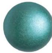
2 Cabochons 18 mm par Puca®-Paris Pastel Emerald