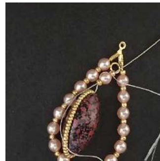
20) Pasar por la R11, la P4 y la R11