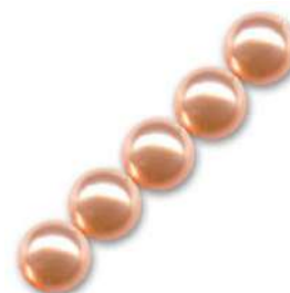
34 Perlas 4 mm (P4) Peach