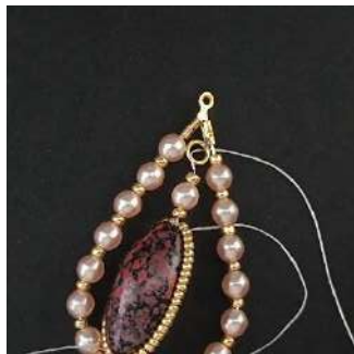
18) Como se muestra aquí