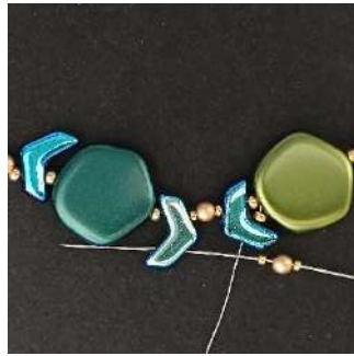
14) Plaats 1 R15, 1 P3, 1 R15 in het 2e gat van de volgende Chevron