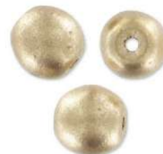
21 ronde kralen 3 mm Gold Mat (P3)