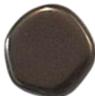
The Cute Polygon FP Selection® 5 Pastel Brown/Bronze (C2)