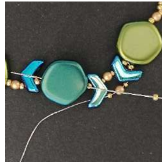
15) Plaats 1 R11 en ga door de Polygon