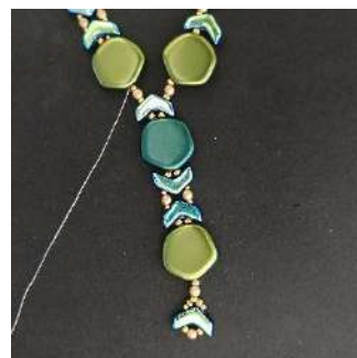
27) U bent hier