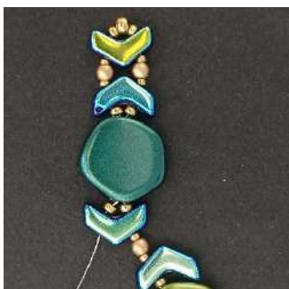
25) U verkrijgt dit. Herhaal stappen 22 tot 24 twee keer; daarna stappen 22 en 23 één keer