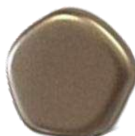
The Cute Polygon FP Selection® 5 Pastel Light Brown Coco (C1)