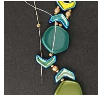
24) Plaats 1 R11 in het 2e gat van de volgende Chevron