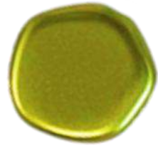
The Cute Polygon FP Selection® 5 Pastel Olivine (C1)