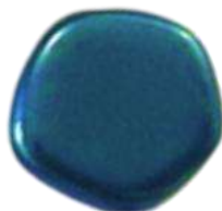
The Cute Polygon FP Selection® 5 Pastel Petrol (C2)