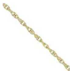
2 x 12 cm ketting (1 optionele verlenging)