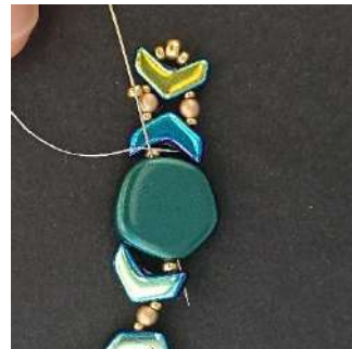
23) Plaats 1 R11 en ga door de Polygon