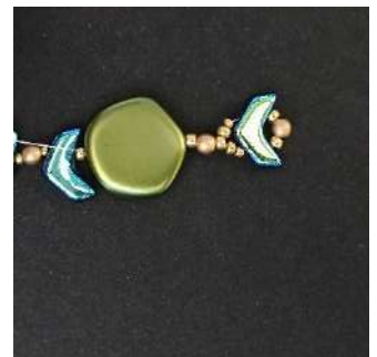
12) U verkrijgt dit