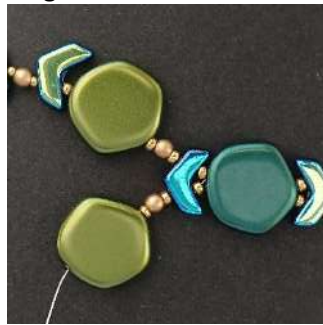
18) U verkrijgt dit. Herhaal stap 8 drie keer, beginnend met een C2, daarna afwisselen