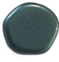
The Cute Polygon FP Selection® 5 Pastel Emerald (C2)