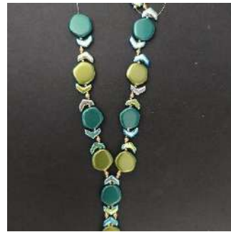
19) U verkrijgt dit