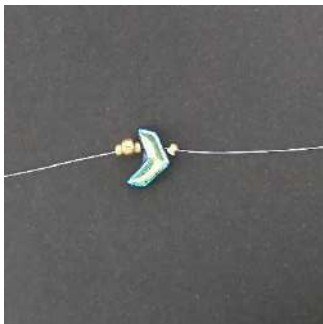
1) Plaats een stopkraal in het midden van de draad, daarna 1 Chevron, 1 R11, 1 R8, 1 R11