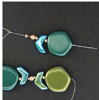
7) Plaats 1 R11, 1 P3, 1 R11, 1 Chevron, 1 R11, 1 Polygon C2