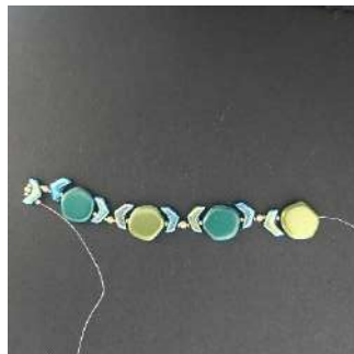
6) U verkrijgt dit