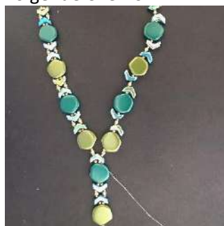
26) U verkrijgt dit