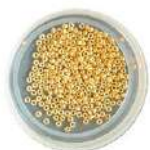
Rocailles 8/0 (R8) Rocailles 11/0 (R11) Rocailles 15/0 (R15)