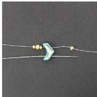
2) Ga door het 2e gat van de Chevron