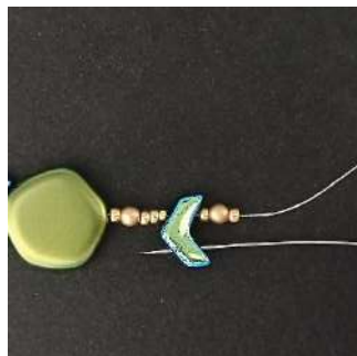
10) Ga door het 2e gat van de Chevron