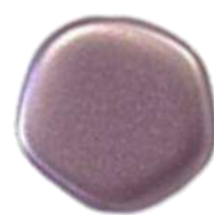
The Cute Polygon FP Selection® 5 Pastel Lila (C1)