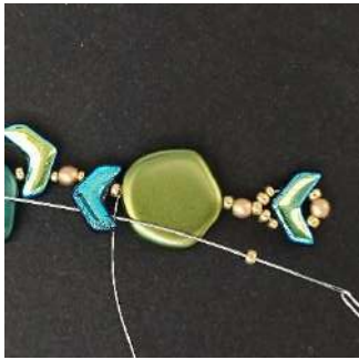
13) Plaats 1 R11 in het 2e gat van de Chevron