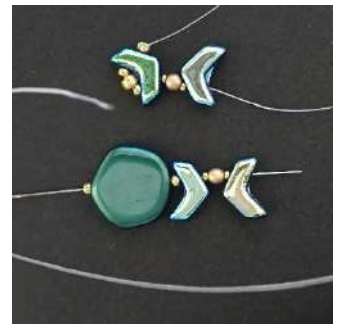
4) Plaats 1 R11, 1 Polygon (C2), 1 R11, 1 Chevron, 1 R15, 1 P3, 1 R15, 1 Chevron, zoals dit