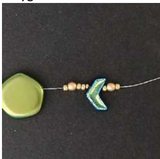
9) Plaats 1 R11, 1 P3, 2 R11, 1 R15, 1 Chevron, 1 R11, 1 P3, 1 R11