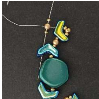
22) Plaats 1 R15, 1 P3, 1 R15 in het 2e gat van de volgende Chevron