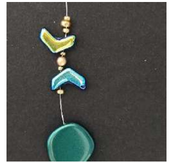
20) Plaats 1 R11, 1 Chevron, 1 R15, 1 P3, 1 R15, 1 Chevron, 1 R11, 1 R8, 1 R11