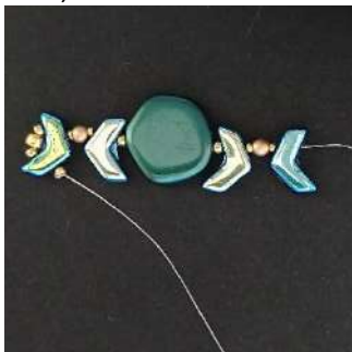
5) U verkrijgt dit. Herhaal stap 4 drie keer en wissel daarbij de kleuren van de Polygon af