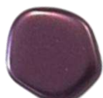
The Cute Polygon FP Selection® 5 Pastel Bordeaux (C2)