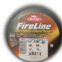
Fireline 0.12 draad