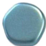
The Cute Polygon FP Selection® 5 Pastel Aqua (C1)