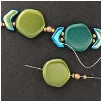
17) Plaats 1 R11, 1 P3, 1 R11, 1 Polygon