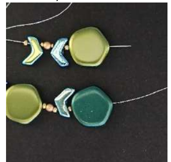
8) Plaats 1 R11, 1 Chevron, 1 R15, 1 P3, 1 R15, 1 Chevron, 1 R11, 1 Polygon C1