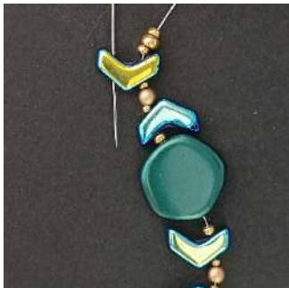
21) Ga door het 2e gat van de Chevron