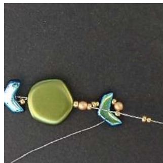
11) Plaats 1 R15, 1 R11 en ga door de R11, de P3, de R11 en de Polygon