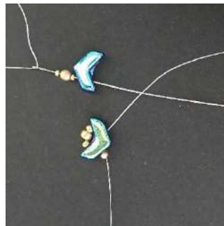
3) Plaats 1 R15, 1 P3, 1 R15, 1 Chevron