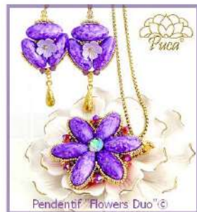
Pendentif "Flowers Duo" © Athos® 3T Mishmash Violet

Boucles d'oreilles "Nora" © par Puca®-Paris