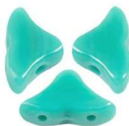
2 Helios Par Puca-Paris®