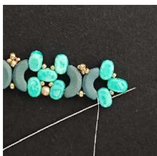
29) Passare nella 2ª foro nella Lipsi