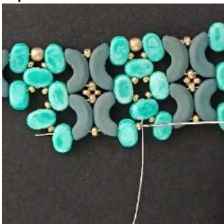
49) Passare nella R15, nella Lipsi, nell'Arcos, nella R11, nell'Arcos, nella Lipsi