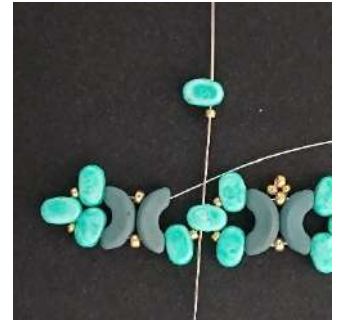
16) Posizionare 1 Lipsi, 1 R15 nel Lipsi centrale così