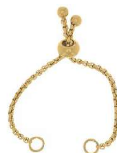
1 chiusura a scelta