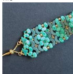
74) Posizionare gli anelli nella R8 e nella chiusura. Il braccialetto è finito

Condividendo sui vari social network, si prega di indicare che questo gioiello è stato progettato da Les Créations d'Anna®- VST Diffusion 2B