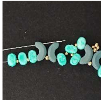
14) Passare nella 3ª foro degli Arcos