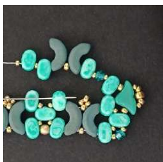
33) Posizionare 1 R11, 1 Lipsi, 1 R15, 1 T3, 1 R15, 1 Lipsi, 1 Arcos, 1 R11, 1 Arcos, 1 Lipsi, 1 R15, 1 Lipsi, 1 R15 e passare nella seconda foro del Lipsi, così