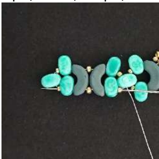
17) Passare nella tutte le perline