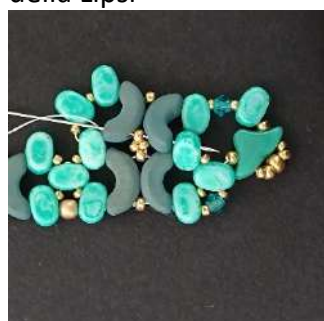
34) Passare nell'Arcos, la R11, l'Arcos, la seconda foro dell'Arcos, come nella foto