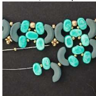
46) Posizionare 1 R15 e passare nella 2ª foro del Lipsi