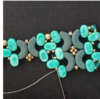
43) Passare nella R15, la Lipsi