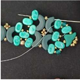
37) Passare nell'Arcos, l'R11, l'Arcos, e nella prima foro nella prossima Lipsi