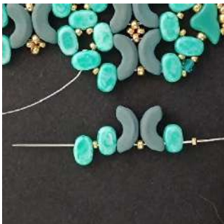
45) Posizionare 1 R15, 1 Lipsi, 1 Arcos, 1 R11, 1 Arcos, 1 Lipsi, 1 R15, 1 Lipsi