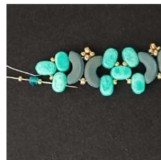
24) Posizionare 1 R15, 1 T3, 1 R15 nella 2ª foro del Lipsi