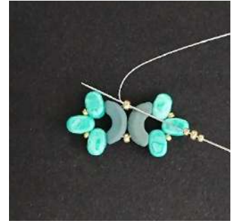
8) Posizionare 1 R15, 1 R11, 1 R15 nell'R11, così