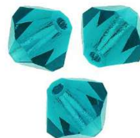
10 Biconi 3 mm (T3)