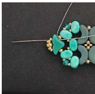
69) Passare nell'Hélios la R15