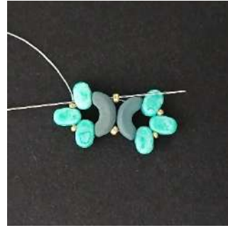
7) Passare nella Lipsi, l'Arcos, nella R11