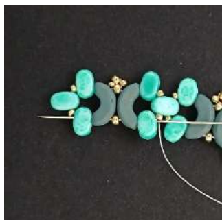
21) Passare in tutte le perline