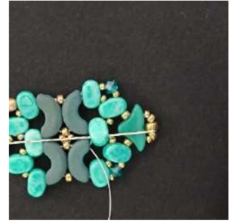
40) Passare nella Lipsi