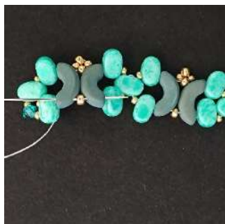
25) Passare nella Arcos, R11 e poi Arcos