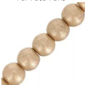
12 perline rotonde 3 mm (T3)