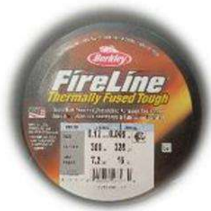
Filo Fireline 0.12