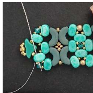
72) Passare nella Lipsi, passare attraverso alcune perline, fare un doppio nodo, tagliare il filo