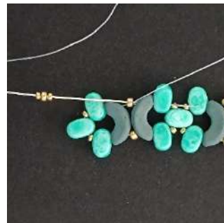
19) Posizionare 1 R15, 1 R11, 1 R15 nella R11, l'Arcos, la Lipsi, la R15 così