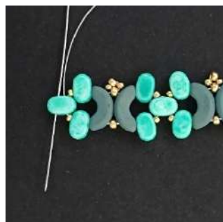
23) Ripetere i passaggi dal 12 al 22, 5 volte