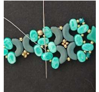
44) Passare nella il secondo buco del Lipsi, così