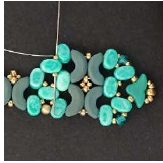
38) Passare nella R15, nella Lipsi, nella R15