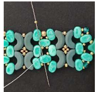
48) Posizionare 1 R15 nel Lipsi, così