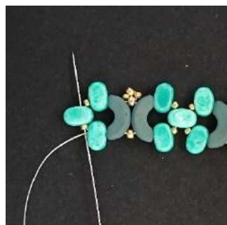
22) Passare nella R15, la Lipsi