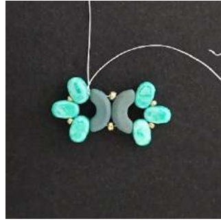
6) Rimuovere perla di stop, fare un doppio nodo, tagliare l'estremità del filo