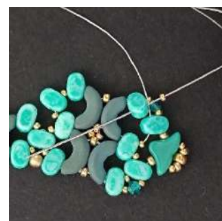
36) Posizionare 1 R15 nella 2ª foro della prossima Lipsi