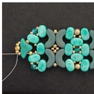
71) Passare nella R15, nell'Hélios, nella R1