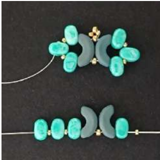
13) Posizionare 1 R15, 1 Lipsi, 1 Arcos, 1 R11, 1 Arcos, 1 Lipsi, 1 R15, 1 Lipsi, 1 R15, 1 Lipsi, così