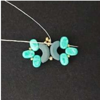
9) Passare nell'Arcos, nella Lipsi, nella R15, nella Lipsi, nella R15