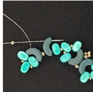
15) Posizionare 1 R11 nella 3ª foro degli Arcos