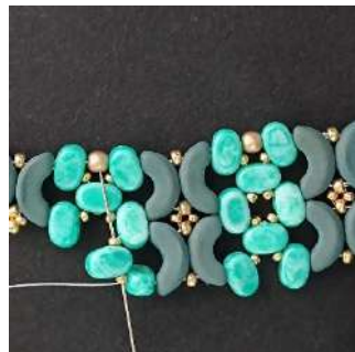
50) Passare nella R15, nella Lipsi, alla R15