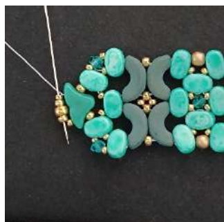
70) Passare nella R11, nella R8, nella R11