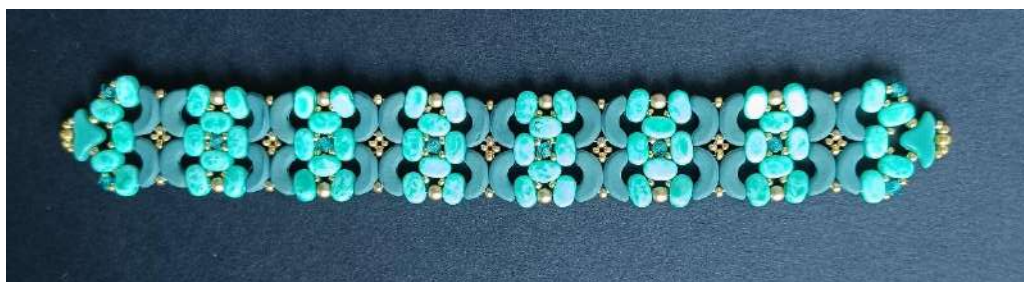
73) Si ottiene questo risultato