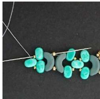
18) Passare nella Lipsi, R15, Lipsi, Arcos e R11