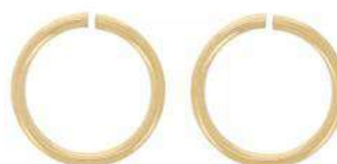
2 Anelli da 4 mm