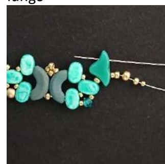
32) Passare nella 3ª foro dell'Helios