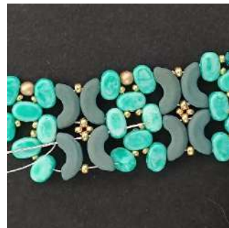
47) Passare nell'Arcos, R11, Arcos, Lipsi, come nella foto