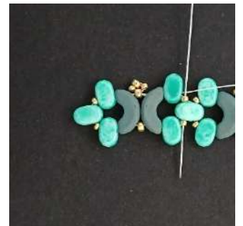
20) Passare nella Lipsi centrale, la R15