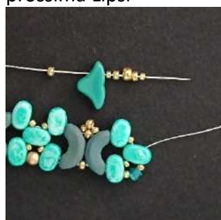
31) Posizionare 1 R11, 1 Helios, 1 R15, 1 R11, 1 R8, 1 R11, 1 R15