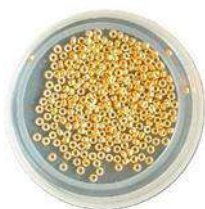
Rocailles 11/0 (R11) Rocailles 15/0 (R15) 2 Rocailles 8/0 (R8)