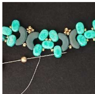
27) Posizionare 1 P3 nella 2ª foro della prossima Lipsi