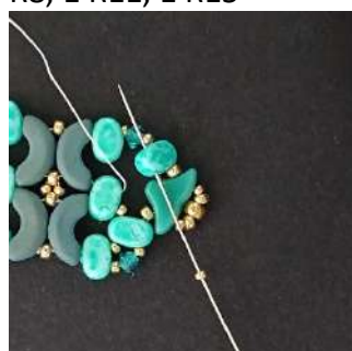
35) Posizionare 1 R15 nella 2ª foro del Lipsi, così