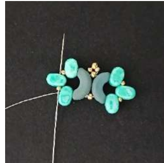
11) Passare nella R15, nella Lipsi