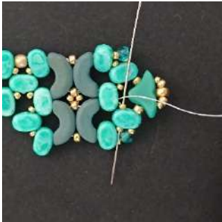
41) Passare nella R15, nella Lipsi, nella R15