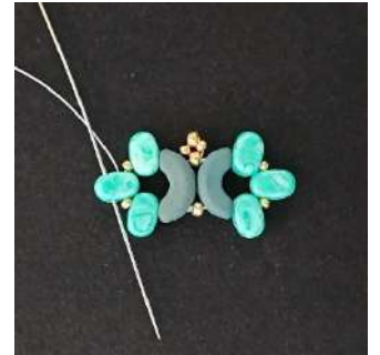
12) Passare nel secondo foro della Lipsi