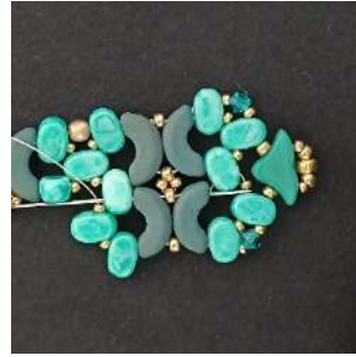
39) Passare nella Lipsi, nell'Arcos, nella R11, nella Arcos