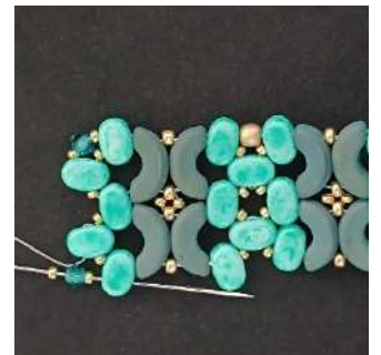
52) Posizionare 1 R15, 1 T3, 1 R15