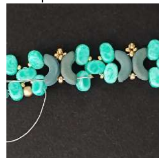
28) Ripetere i passaggi da 25 a 27 per tutto il lungo