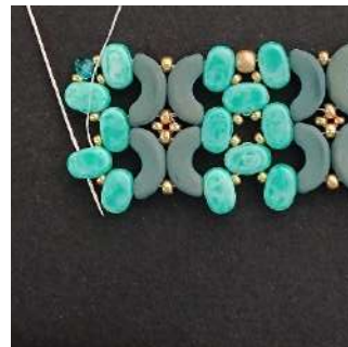
51) Passare nella seconda foro del Lipsi