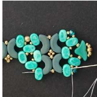
42) Passare nella Lipsi, nell'Arcos, nella R11, nell'Arcos, nella Lipsi