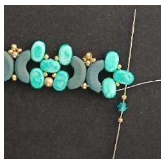
30) Posizionare 1 R15, 1 T3, 1 R15 nella 2ª foro della Lipsi