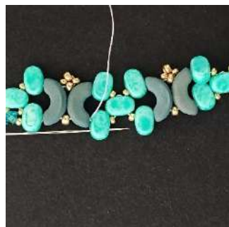
26) Passare nella 2ª foro del Lipsi