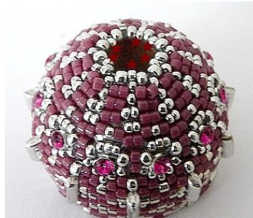
59) Plaats 1 R15 tussen de R11. Trek uw werk aan.