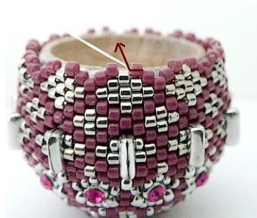
62) Dan krijgen we dit. 😊 Plaats de naald HIER in de DB11 (Roos).