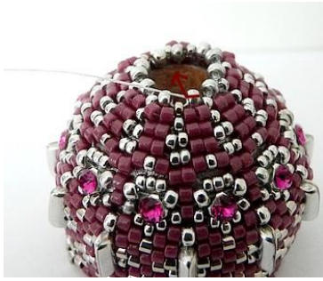
58) Dat ziet er zo uit. 😊 Plaats de naald HIER in de R11.