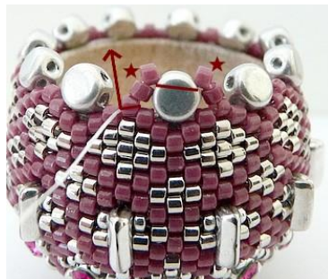
65) Plaats 2 DB11 (Roos) aan elke kant van de Kalos (bovenste opening). GR