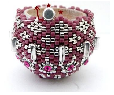
63) Plaats 1 DB11 (Roos), 1 Kalos. GR