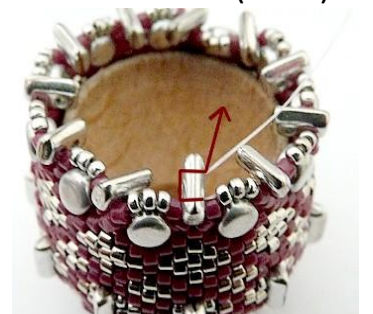
69) Plaats de naald in de 2 e opening van de Piros.