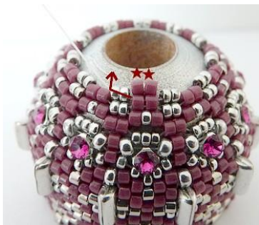
49) Plaats 2 DB11 tussen de R15. GR