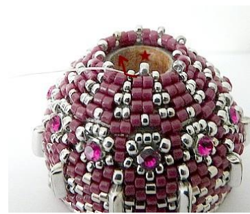
57) Plaats 1 R11 tussen elke R15. GR