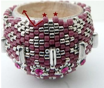
61) Plaats 2 DB11 (Roos) en ga door de drie DB11 (Roos). GR