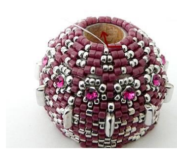
54) Dan krijgen we dit. 😊 Plaats de naald HIER in de twee DB11.