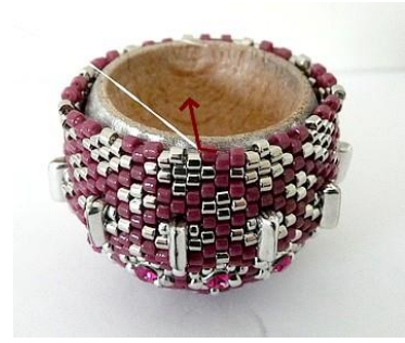
60) Draai uw werk om. Plaats de naald HIER in de DB11 (Roos).