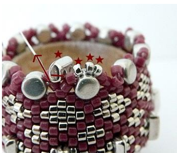
67) Plaats 3 R15 dan 1 Piros. GR