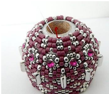
52) Dan krijgen we dit. 😊 Plaats de naald HIER in de R15.