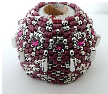
50) Dan krijgen we dit. 😊 Plaats de naald hier (DB11 Roos).