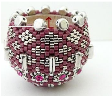
64) Dan krijgen we dit. 😊 Plaats de naald HIER in de DB11 (Roos).