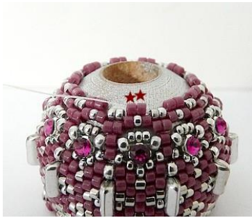
46) Plaats 2 DB11 tussen de 2 R15. GR