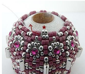
47) Plaats 2 R15 tussen de DB11 (Roos). GR