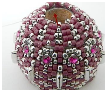
56) Dan krijgen we dit. 😊 Zet naald in R15.