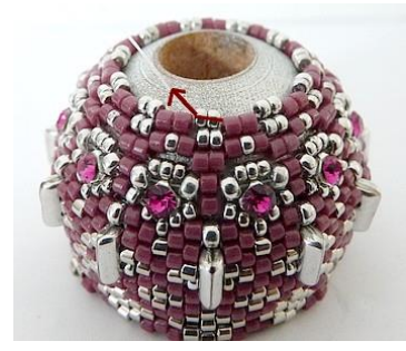
48) Dan krijgen we dit. 😊 Plaats de naald HIER (R15).