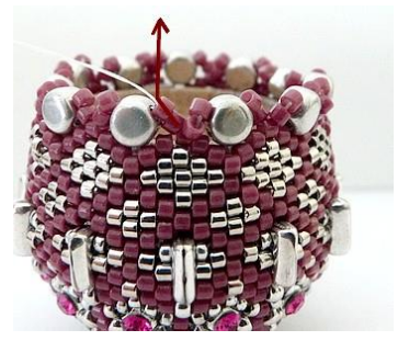
66) Dan krijgen we dit. 😊 Plaats de naald HIER in de twee DB11 (Roos).