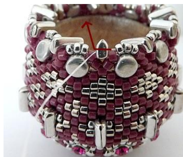
68) Dan krijgen we dit. 😊 Plaats de naald in de Piros.