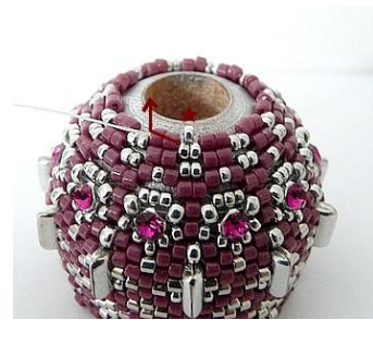
51) Plaats 1 R15 tussen de twee DB11 (Roos). GR