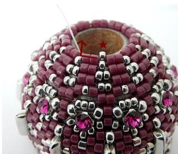
55) Plaats 1 R15 tussen de twee DB11. GR