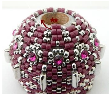
53) Plaats 2 DB11 tussen elke R15. GR