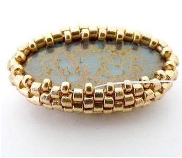
7) Maak één rij met R15.