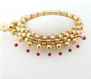
13) Plaats in totaal 7 R11.