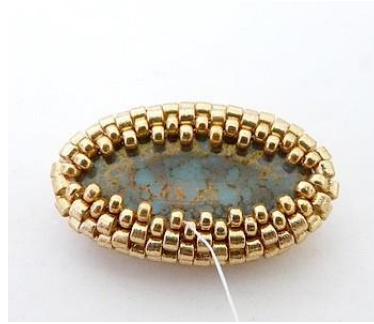
8) Maak een tweede rij met R15, trek goed aan.