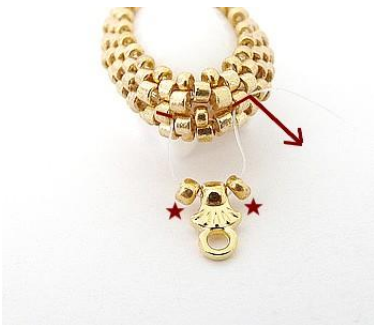
10) Plaats 1 R11, 1 Cymbal (eindogje), 1 R11. Plaats de naald HIER.