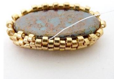
6) Draai uw werk om, plaats uw Athos en rijg 2 rijen peyote, DB11.