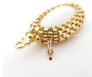
12) Plaats 1 R11 tussen de DB11.