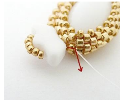
15) Plaats uw naald in de R15 op de kop.