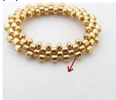
5) Plaats een rij R15 en plaats de naald vervolgens HIER aan de buitenkant .