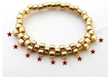
2) Plaats 9 DB11 in peyottesteek.