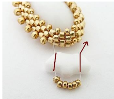
14) Plaats 1 Delos, 6 R15, en ga doorheen de Delos.