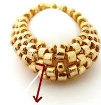
9) Plaats uw naald HIER.