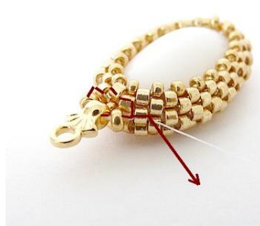
11) Verstevig en positioneer de naald HIER.