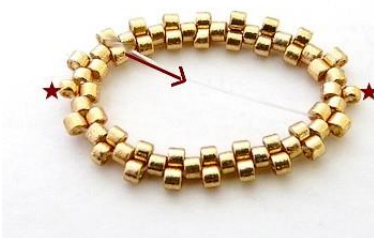
4) Plaats 9 DB11, 1 R15 en plaats de naald HIER aan de binnenkant .