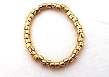
1) Plaats 40 DB11 en sluit.