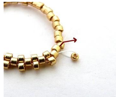
3) Plaats 1 R15 (op de kop).