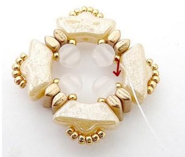
7) Ecco il risultato 😊 Uscire QUI dalla R15