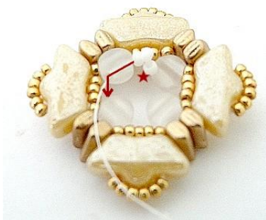
10) Inserire 3 R15 tra le Kalos (foro basso) così per tutto il giro 😊