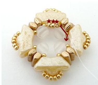
8) Tra le R15 inserire 3 R15, così per tutto il giro