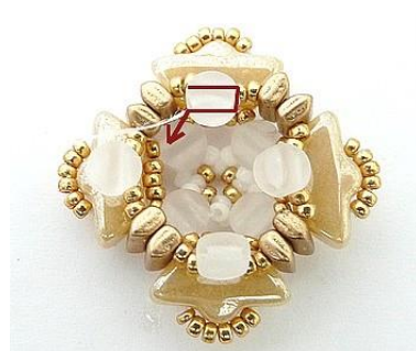
15) Ecco il risultato 😊 Portarsi ad uscire dalla Kalos (foro basso)