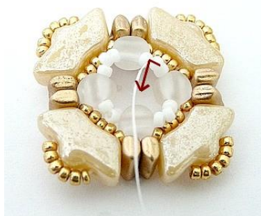
11) Ecco il risultato 😊 Uscire QUI dalla R15 centrale