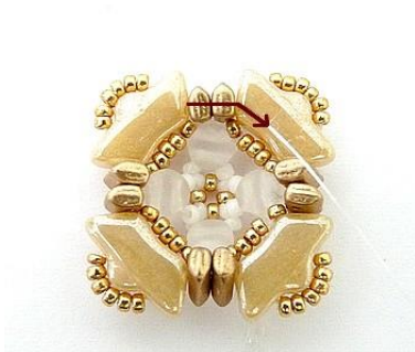
13) Capovolgere il lavoro ed uscire QUI dalle due Piros