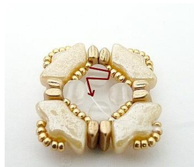
9) Ecco il risultato 😊 Uscire QUI dalla Kalos (foro basso)