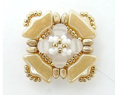
12) Inserire 1 R15 tra ogni R15 centrale