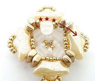
14) Inserire 2 R15, 1 Kalos, 2 R15 tra ogni gruppo di due Piros. Così per tutto il giro 😊