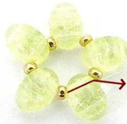
2) Sluit en plaats de naald in de Samos.