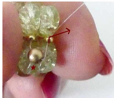
5) Plaats 1 PR3 in de tegenoverliggende R11 (om uw werk te ritsen).