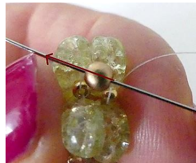
6) Ga terug door de PR3.