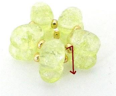
4) Plaats uw elementen op elkaar en plaats de naald in de R11.